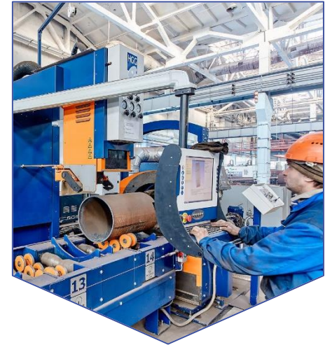
Производство металлоконструкций [в том числе с ориентацией на экспортные поставки]

В настоящее время в данном направлении представлены два предприятия, получившие статус резидентов ТОСЭР: АО «ПО «Комплекс» и ООО «Нитро Сибирь Заполярье»