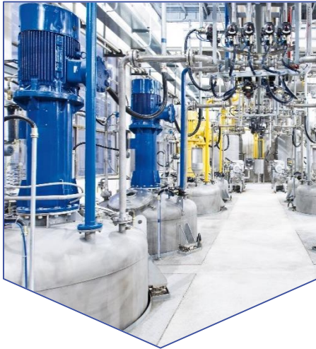
Производство сопутствующих химических производств