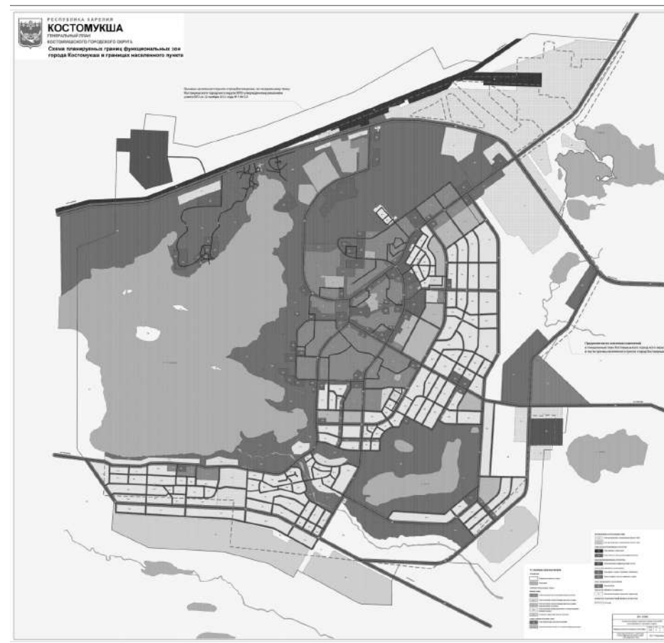
Схема планируемых границ функциональных зон города Костомукша Муниципального образования «Костомукшский городской округ» Республики Карелия в границах населенного пункта